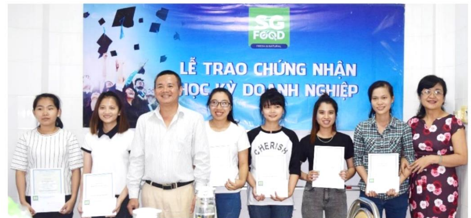
Lễ trao chứng nhận cho sinh viên Đại học Nha Trang